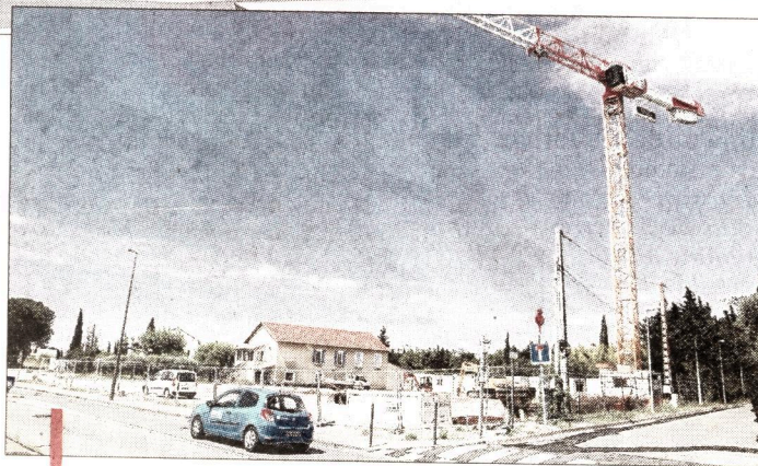
Le chantier a démarré en avril, sur un ancien champ de vignes, à quelques mètres du pôle santé, à Carpentras.

Ce pôle bâti sur cinq niveaux recevra des médecins (ORL, ophtalmologues, esthétique, nutritionniste), des chirurgiens (oraux, dentaires, maxillo-faciale, esthétique) mais aussi des professionnels paramédicaux (kinésithérapeutes vestibulaires et maxillo-faciale, ostéopathes, posturologue, prothésistes dentaires, sophrologue, hypnothérapeute, audioprothésiste, opticiens, esthéticienne). Enfin, au 4 e niveau, sur le rooftop de l'immeuble, un centre de formation en connexion avec des blocs opératoires ou d'autres salles de la